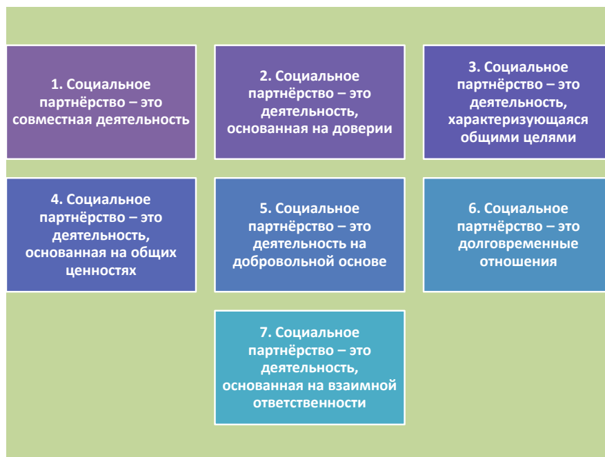
Рис. 2 – Характеристики социального партнёрства

Важность развития социального партнёрства обусловлена тем, что лицей, являясь важным социальным компонентом жизни общества, отражает его характерные признаки (см. рисунок 3)