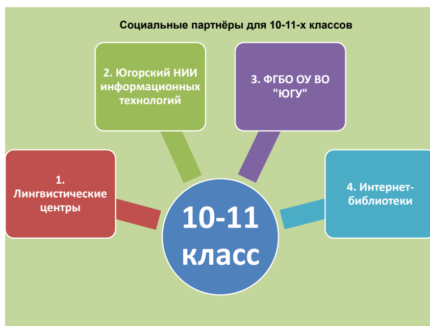
Рис. 5 – Социальные партнёры для 10-11-х классов

Считаю, что для обучающихся лица, которые ориентированы на углубленное изучение физики, математики и информатики, необходимо получать дополнительные навыки и знания, для чего я создала сеть социального партнёрства, которая способна принести большой вклад в повышение качества образования (см. рисунок 5)