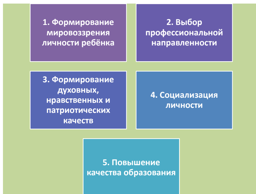
Рис. 4 – Задачи социального партнёрства

Вышеперечисленные задачи позволяют решить главную цель социального взаимодействия: внедрить в образовательный процесс систему взаимосвязанных видов деятельности, в основе которой лежат развитие интеллекта учеников, их ценностного отношения к миру.