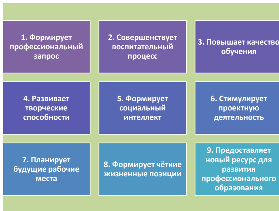
Рис. 6 – Социальный эффект взаимосотрудничества школы с социальными партнёрами

Исходя из вышесказанного, можно сделать вывод, что социальное партнёрство, это сложный процесс, который развивается длительное время и зависит от целого ряда объективных и субъективных причин.